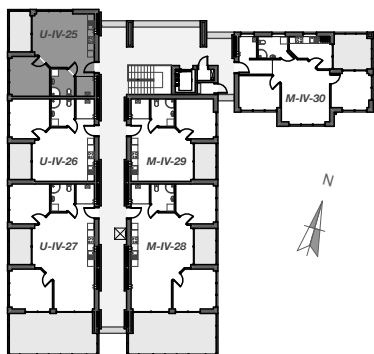
WIDOK IV KONDYGNACJI