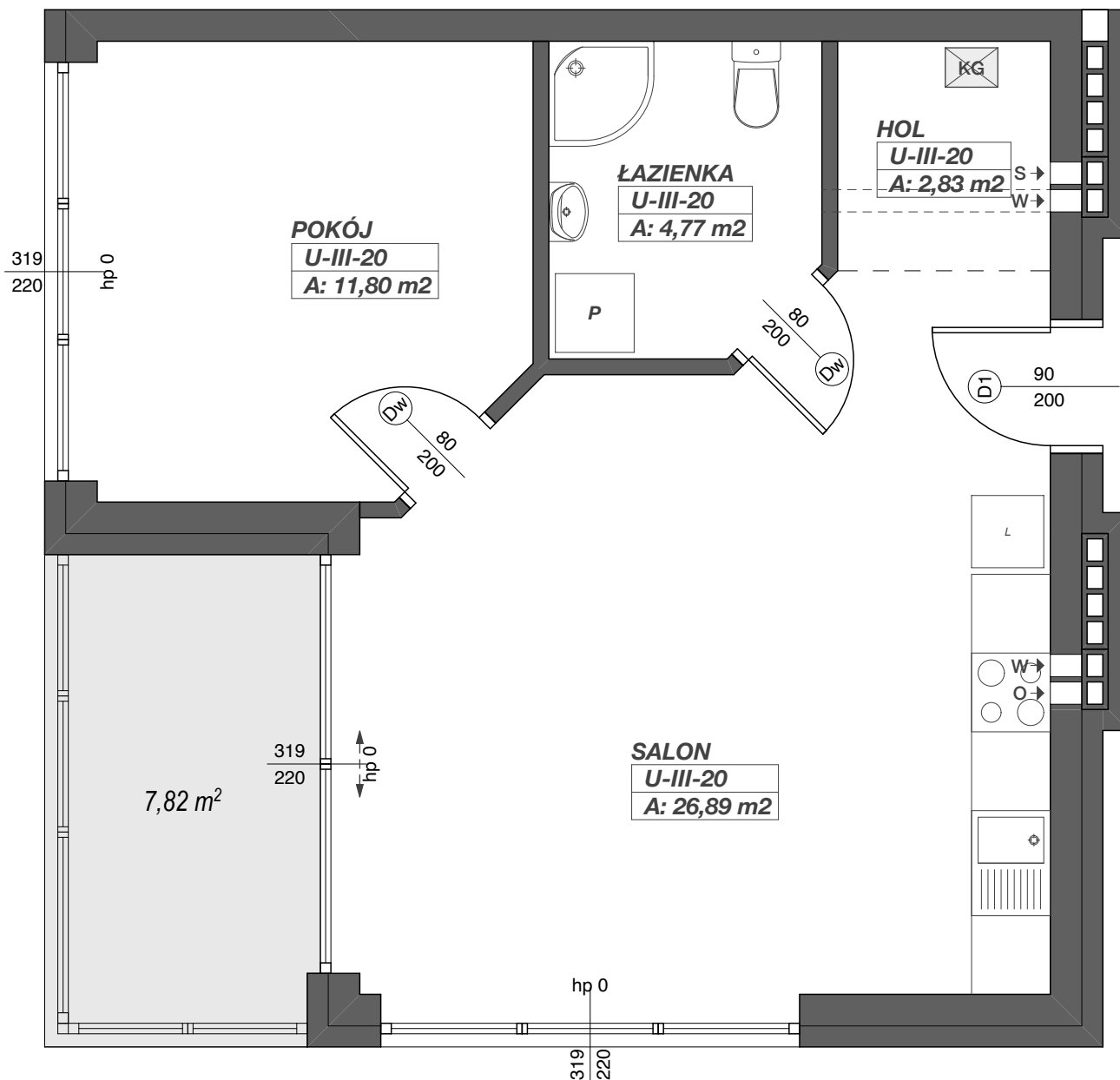
RZUT LOKALU USŁUGOWEGO O FUNKCJI TURYSTYCZNO-REKREACYJNEJ - APARTAMENT - skala 1:50