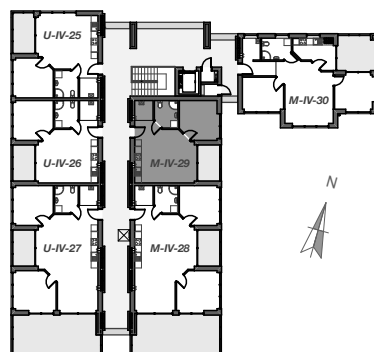
WIDOK IV KONDYGNACJI