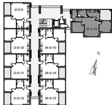
WIDOK II KONDYGNACJI